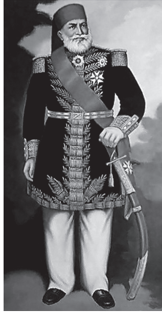
محمد علي باشا.

لم يزل سعيد يذكر هذه اليد للقناصل ولا سيما قنصل فرنسا، وكان معجباً بالثقافة الفرنسية، كثير الاختلاط بالفرنسيين والأجانب على العموم، يجيد الفرنسية ويتكلم الإنجليزية. وفي عهده حصل «فرديناند دلسبس» على امتياز فتح القناة بشروط غاية في الإجحاف والخطر على حقوق مصر والدولة العثمانية. وفي عهده طلب «نابليون الثالث» فرقة سودانية لإخضاع الثائرين في المكسيك، فأجابه إلى طلبه وأنفذ إلى المكسيك فرقة من أبناء السودان ومصر لتحل هناك محل الجنود الفرنسيين الذين فتكت بهم الحمى الصفراء وتبين أنهم لا يحتملون أهوية البلاد وحمائتها كما يحتملها الأفريقيون. وأرادت البيوت المالية في إنجلترا أن تقابل هذا النفوذ الفرنسي بمثله، فعمدت إلى تشجيع الوالي على الاقتراض فأقدم عليه غير هياب لجرائره، ومات وعليه عدة ملايين من الديون الأجنبية يختلفون في مقدارها بين ثلاثة ملايين وأحد عشر مليوناً من الجنيهات. وكان «سعيد باشا» يخفي حقيقة هذه الديون؛ لأن شروط الولاية لا تسمح له بعقد القروض